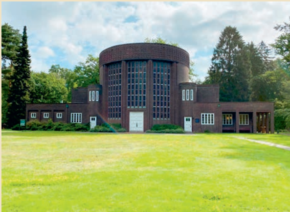
Friedhof Ohlsdorf, Kapelle 13

Für eine Trauerfeier können Friedhofskapellen und Kirchen genutzt werden, unabhängig vom Beisetzungsort. Die Trauerfeier ist hier zeitlich begrenzt.