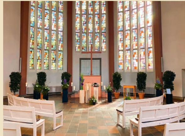
Friedhof Ohlsdorf, Kapelle 13